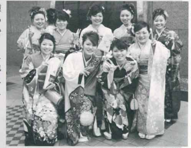
※昨年の成人式から

今日から社会の一員であること、何よりも家族の優しい愛に包まれて成長してきたことを忘れず、幸多い未来へ羽ばたかれることを心からお祈りいたします。