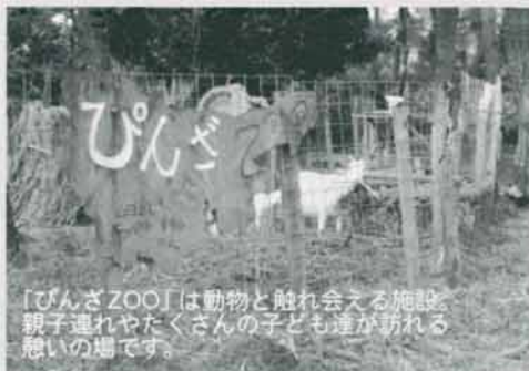
「びんざZOO」は動物と触れ合える施設。親子連れやたくさん子ども達が訪れる憩いの場です。

ウサギやヤギなど小動物が暮らす、宮古島市熱帯植物園内の「びんざZOO」で十一月末、ヤギ一匹とニワトリ一羽がそれぞれかまれた傷跡を残して死んでいるのが発見されました。野犬による被害と見られるこの一件、野犬といっても、そのほとんどがもとと飼いで、人間に捨てられた犬が大半を占めています。真の被害の原因は犬ではなく、私たち人間、飼い主のマナーにあります。ペットは生活を共にする家族の一員。愛情をもって一緒に暮らしましょう。